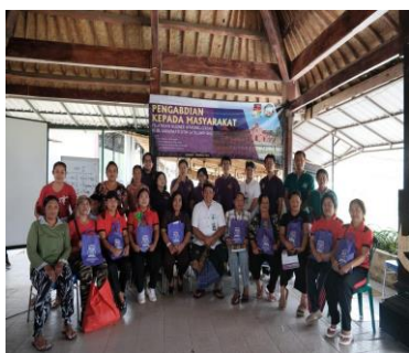
Gambar 4. Pemberian Goodie Bag Sebagai cinderamata untuk peserta pelatihan