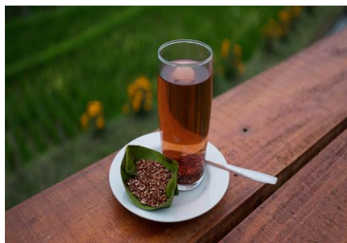
Gambar 1. Teh Beras Merah