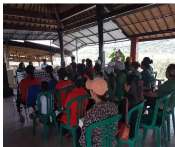
Gambar 2. Pembukaan kegiatan Pkm Dihadiri oleh peserta dari UMKM