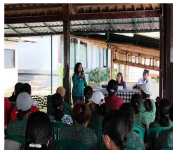
Gambar 3. Pembicara dari Tim kegiatan Pkm, memberikan penjelasan informasi produk