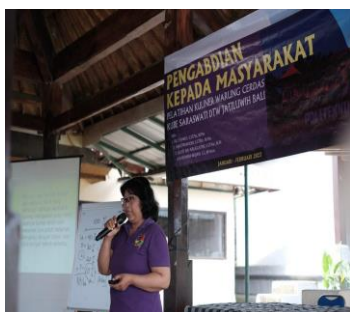
Gambar 6. Pemaparan cara pemasaran produk dengan menggunakan Bahasa Inggris