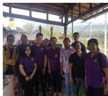
Gambar 5. Tim PkM PIB Dosen dan Mahasiswa panitian PkM