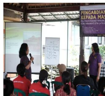
Gambar 7. Pemaparan cara pemasaran dengan menggunakan Bahasa Indonesia

Pelaksanaan PKM Sosialisasi Pengemasan Produk Kuliner Olahan UMKM KUBE Saraswati melalui Buklet Bahasa Inggris sebagai Media Promosi di Desa Wisata Jatiluwih, Tabanan, Bali yang telah berjalan lancar dan sesuai dengan tujuan dari kegiatan PkM.