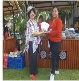
Gambar 9. Penyerahan Buklet Produk Kuliner Khas Jatiluwih