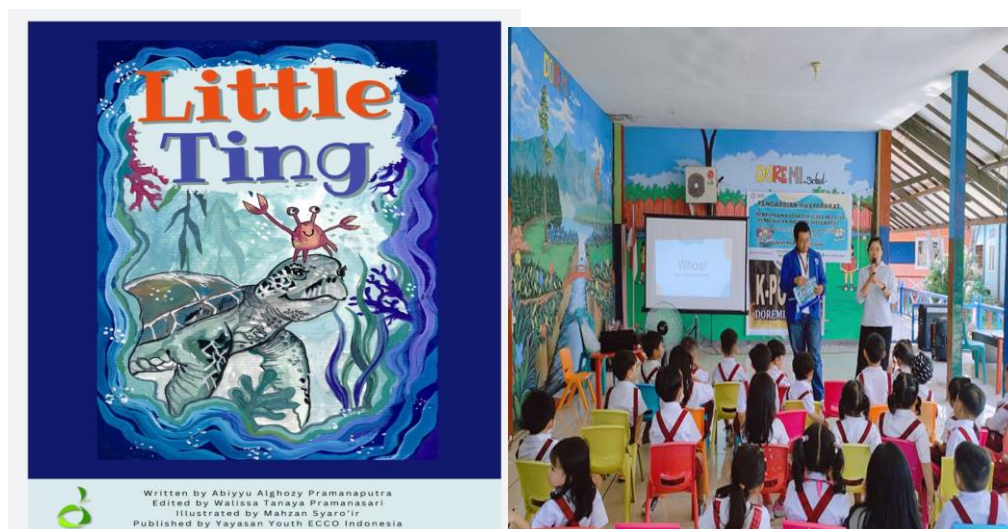
Gambar 3. Penyampaian Materi English Literacy

Pada penyampaian materi Cleanliness siswa/siswi dimaksudkan untuk meningkatkan kepedulian anak-anak usia dini akan pentingnya kebersihan untuk menghadapi new normal melalui gerakan kebersihan dengan metode demonstrasi, bernyanyi, tanya jawab dan pembiasaan melalui media animasi. Misalnya guru memperagakan urutan cara mencuci tangan, dan menyikat gigi sesuai aturan yang baik dan benar, bernyanyi tentang tahapan mencuci tangan yang dapat dilakukan terus menerus agar siswa/siswi terbiasa akan pentingnya kebersihan.