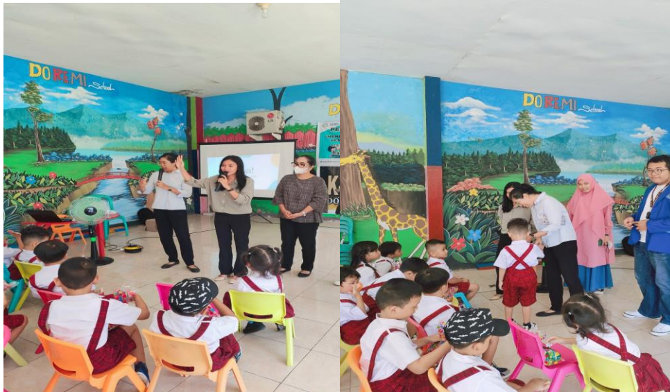
Gambar 4. Penyampaian Materi Arrangement of Time

Pada penyampaian materi English Literacy untuk meningkatkan minat baca anak dengan gerakan literasi melalui buku cerita bergambar dengan metode bercerita dan keteladanan.. Cara ini sangat baik untuk meningkatkan imajinasi dan kreativitas anak. Umumnya dengan metode bercerita anak akan belajar dari dongeng yang telah disampaikan misalnya mengenai pesan yang terkandung dalam suatu cerita atau dongeng dan tokoh-tokoh dalam dongeng dapat menjadi teladan.