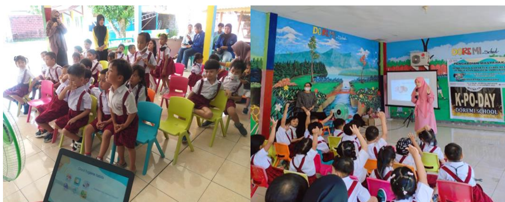
Gambar 2. Penyampaian Materi Cleanliness

belajar mengajar daring sebelumnya mengakibatkan kurangnya kepedulian akan kebersihan, minat baca dan pengaturan waktu siswa-siswa TK Doremi Mataram dalam menghadapi era new normal. Pelaksanaan kegiatan pengabdian pada masyarakat dengan tema di TK Doremi Mataram penting dilakukan, guna meningkatkan kesadaran dan kepedulian siswa dalam menghadapi proses belajar mengajar di era new normal di sekolah melalui pembelajaran yang menyeluruh dan berpusat pada siswa. Tidak hanya itu pembelajaran yang dapat membangun karakter dan kesadaran akan kebersihan, literasi dan disiplin waktu sangat diperlukan. Ketiga karakter melalui tiga topik pembelajaran ini terintegrasi pada kegiatan bermain anak. Pada pelaksanaannya pembelajaran melalui pendekatan holistik integratif dilakukan sambil bermain, bernyanyi, mendengarkan cerita dan menstimulasi respon tanggap anak terhadap beberapa pertanyaan terkait kebersihan, literasi dan pengelolaan waktu. Kegiatan ini berlangsung selama 2,5 jam yang diikuti oleh seluruh siswa/siswi TK DOREMI yang berjumlah 32 siswa.