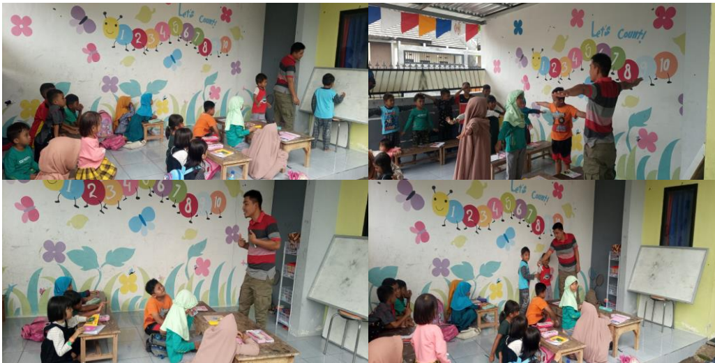
Gambar 1: Kegiatan Pelatihan Bahasa Inggris anak-anak TK dan SD

Grafik 1, merupakan grafik yang disajikan untuk menunjukkan grafik peningkatan nilai para peserta pelatihan dari latihan satu ke latihan tiga yang dikumpulkan oleh penulis.