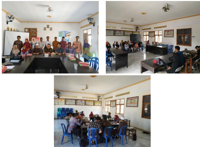
Gambar 2. Pelaksanaan kegiatan Sosialisasi Perlindungan Konsumen Makanan Kadaluwarsa Bersama Dosen Universitas Nahdlatul Wathan Mataram (UNW) Mataram di Desa Kuta, Kec. Pujut

Adapun hasil dokumentasi pelaksanaan kegiatan sosialisasi dapat dilihat pada Gambar 2 dibawah ini.