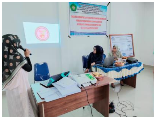
Gambar 2. Pelatihan dan Pendampingan Desain Label Produk dengan menggunakan CorelDraw