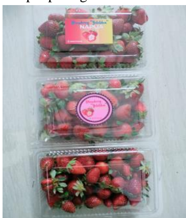
Gambar 3. Perbandingan Kemasan Produk Setelah Branding

Berdasarkan hasil dari pelaksanaan pengabdian masyarakat, pengamatan dan diskusi baik langsung maupun dari komunikasi pelaku usaha serta kepala Distrik, dan kepala Kampung sebanyak 6 orang. Adapun label produk telah digunakan secara berkelanjutan dalam usaha strawberry dan strawberry ini telah lebih dikenal masyarakat. Jumlah konsumen pun meningkat dengan adanya branding dan label pada kemasan produk. Berikut merupakan dokumentasi perbandingan penerapan desain produk pada usaha strawberry terdapat pada gambar 3.