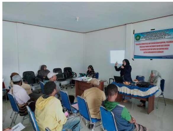
Gambar 1. Presentasi Tim Pemateri Penjelasan Branding dan Labeling Produk UMKM

Pelaksanaan pengabdian masyarakat diawali persiapan kegiatan dengan mempersiapkan materi presentasi diantaranya: branding, labeling, dan desain label dengan aplikasi coreldraw. Setelah mendapatkan arahan dari pelaku usaha strawberry dan kepala distrik Napua, kegiatan dilaksanakan pada hari selasa tanggal 22 maret 2022 dimulai dari jam 09.00 – 16.00 wit di Kantor Distrik Napua yang dihadiri oleh para pelaku usaha, stake holder, dan pejabat pemerintahan di kantor distrik napua serta kantor kampung okilik Sebanyak 14 orang. Kegiatan Diawali dengan penjelasan tentang tentang branding, labeling. Adapaun dokumentasikegiatan dapat dilihat pada gambar 1.