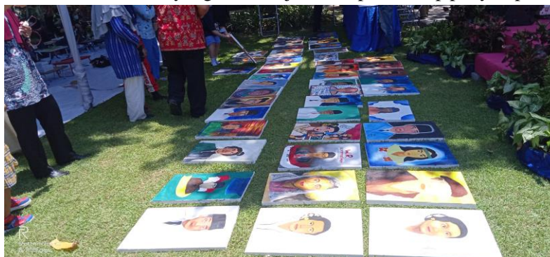
Gambar 4. Proses Evaluasi Dan Seleksi Lukisan Potret Anak Bangsa Terbaik

Tahap evaluasi kegiatan workshop melukis tokoh bangsa dilakukan beberapa tahap yaitu evaluasi secara menyeluruh dan memisahkan karya yang layak dipamerkan. Evaluasi ini akan seleksi secara keseluruhan pada semua peserta sebanyak 50 orang yang akan dinilai oleh semua pendamping lukis kegiatan workshop berdasarkan kriteria yang sudah dijelaskan pada tahap penyampaian materi gambar.