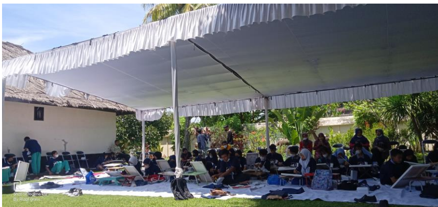
Gambar 2. Proses Pembukaan Mempragakan Alat Dan Bahan Melukis

Pembukaan kegiatan ini dihadiri oleh kepala museum NTB, Kepala museum Basoeki Abdullah, Komunitas SakArt, dan guru pendamping siswa/siswi. Kegiatan workshop melukis potret tokoh bangsa dibuka langsung oleh kepala Museum Basoeki Abdullah sekaligus penyampaian materi yang akan diambil alih oleh pemateri.