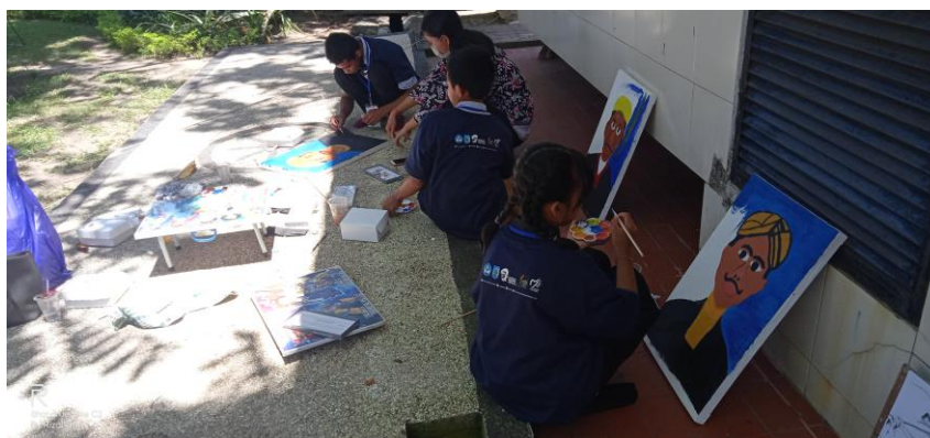
Gambar 3. Proses Pendampingan Melukis Berdasarkan Kelompok

Tahap kegiatan pendampingan peserta melukis, kami melakukan pendampingan secara langsung kepada peserta selama proses kegiatan workshop . Mulai dari tehnik mencampur cat sampai pada tahap tehnik permainan warna. Demi menjalankan kegiatan dengan baik maka tim pendamping berpencah berkelompok dan didampingi oleh pemateri dan panitia workshop melukis potret tokoh bangsa.