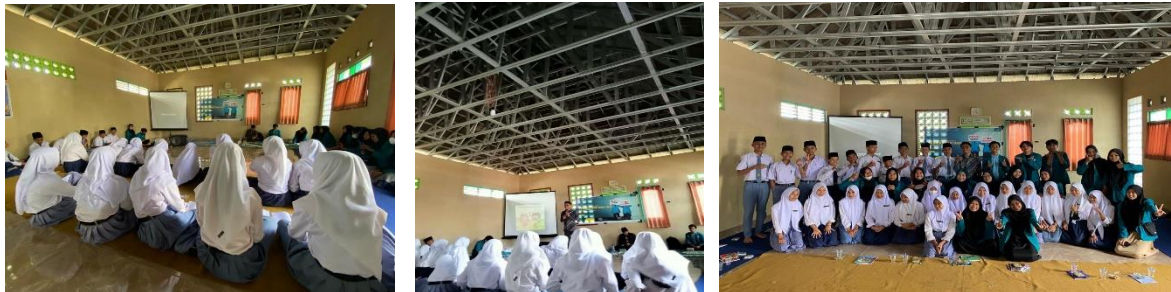
Gambar 2. Pelaksanaan kegiatan Sosialisasi bersama Tim KKP UIN Mataram di Lendang Are Kec.Kopang

Adapun hasil dokumentasi pelaksanaan kegiatan sosialisasi dapat dilihat pada gambar 2 dibawah ini.