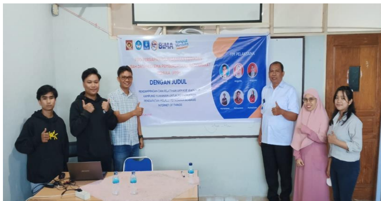
Gambar 2. FGD Persiapan tim pelaksana

Kegiatan focus group discussion tim pelaksana pemberdayaan masyarakat pemula Sebelum turun kelapangan, kegiatan tersebut bertempat dapat dilihat pada gambar 2.