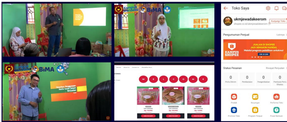
Gambar 4. Kegiatan Transfer Ipteks

Pada kegiatan transfer ipteks tim pelaksana memberikan pelatihan, pemanfaatan media sosial dalam berjualan, pencatatan laporan keuangan yang baik, pelatihan penggunaan website sebagai media promosi dan penjualan, pelatihan pembuatan kemasan produk yang layak jual.