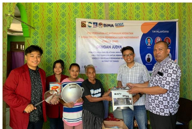
Gambar 3. Penyerahan secara simbolis Peralatan produksi

Pada Gambar 2 menunjukkan kegiatan focus group diskusi dilakukan untuk membahas persiapan sebelum turun kelapangan mendampingi mitra PMP. Kegiatan penyerahan bantuan peralatan produksi yang dilaksanakan pada kegiatan pemberdayaan masyarakat pemula dapat dilihat pada gambar 3.